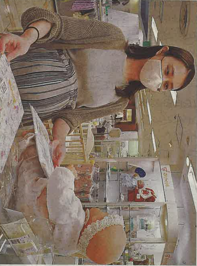
予定日まで1カ月を切った。ベビー用品選びが日々の楽しみだ

妊娠している調べるために、あらためて出産・子育ての教など体面ももちろん大切だが、「落差」があるの用が多さに響き、保護者は、北九州市に毎日の生活に目を向けた策が少ないからではないか。 市は「子育てしやすい日本」という高い目標を掲げている。当事者であるママやパパが満足できるような、さらなる手厚い施策を期待している。