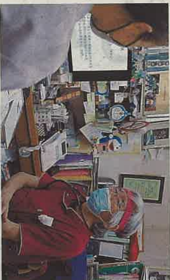
(右)左は私 だ小児科の吉田雄司医師 産後の流れを説明する「よし